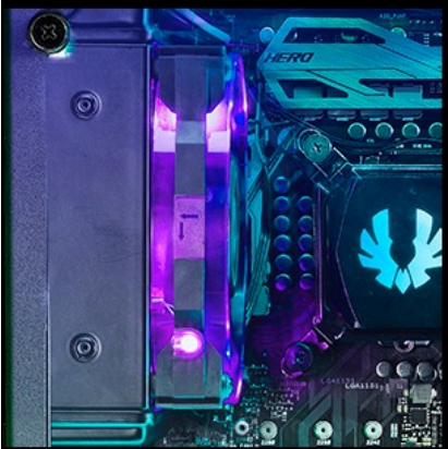
120mm ( radiator )